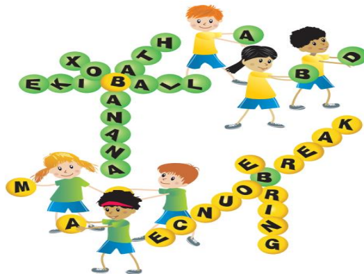
Hình 1. Trò chơi "B as BRAINBALL" (Rokita et al., 2018)